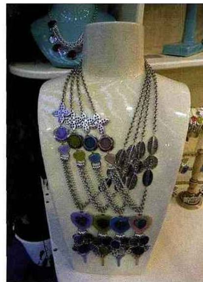
Bijoux (Fantasia Sud)