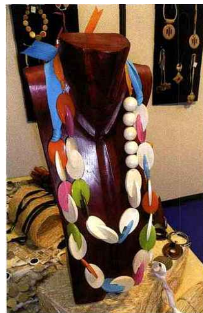
Colliers (Elle Aime)